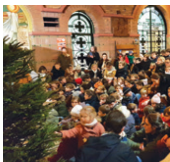
P.2 Spectacle de l'aveut : l'histoire de la crèche vivante de Saint-François