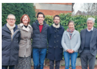
P.3 EAP : ils témoignent