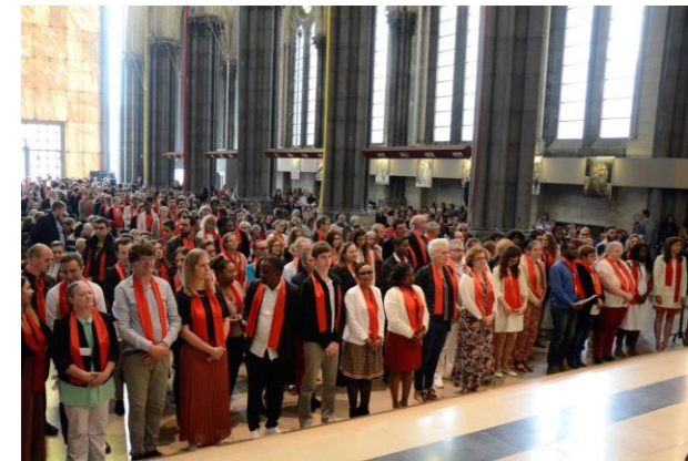
Pentecôte 2019 – Cathédrale de la Treille à Lille Confirmation de plus de 180 adultes et jeunes qui, comme les Apôtres à la Pentecôte, ont accueilli cette force de l'Esprit Saint pour mieux grandir dans la foi et être des témoins de l'amour de Dieu.

Seigneur, notre Dieu, dans les éclairs et le feu, sur la montagne du Sinaï, tu as donné à Moïse l'ancienne loi, et dans le feu de l'Esprit, au jour de la Pentecôte, tu as révélé l'Alliance nouvelle : accorde-nous de toujours brûler de cet Esprit que tu as répandu mystérieusement sur tes Apôtres, et donne à l'Israël nouveau, rassemblé de toutes les nations, d'accueillir avec joie l'éternel commandement de ton amour.