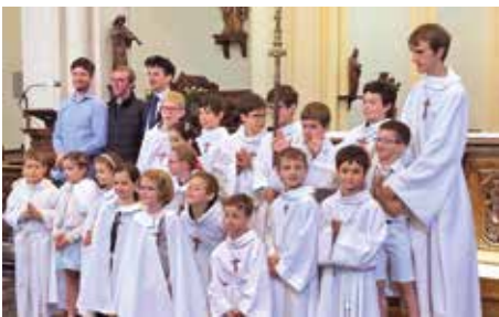
Remise de croix pour les servants d'autels.

(en respect des mesures de distanciation en vigueur) - Samedi soir à 18h à l'église Saint-Vital (parvis Saint-Vital) - Dimanche matin à 10h à l'église Sainte- Marie-Madeleine (160, rue du Général- de-Gaulle), à 11h15 à l'église Notre- Dame-de-Lourdes (8, avenue Simone)